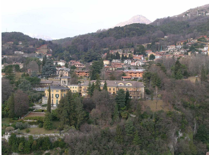
Il complesso “Suore della Sapienza”.